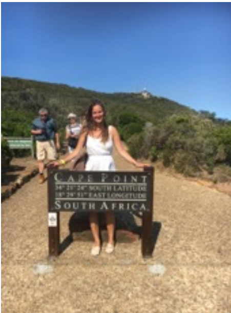
Ausflug ans „Cape of Good Hope“