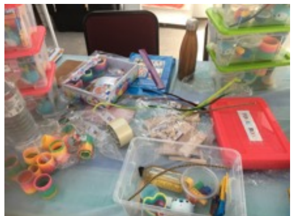
Vorbereitungen für Schulprogramme

Regel auf montags bis freitags von 9 bis 17 Uhr. In der ersten Woche durfte ich noch keine eigenen Therapiesessions durchführen, sondern sollte mich erst einmal im „Hope House“ einleben und wurde von meiner Betreuerin eingearbeitet. Sie gab mir verschiedenes Informationsmaterial über das Western Cape und seine Bewohner, die ich mir anschauen sollte, um einige der Lebenshintergründe meiner künftigen Patienten besser zu verstehen. Zudem erzählte sie mir, wie Therapiestunden im „Hope House“ durchgeführt werden, und gab mir einen allgemeinen Einblick über den Stellenwert, den Therapie in Südafrika einnimmt. So erzählte sie mir beispielsweise, dass Therapie in vielen Familien verpönt sei, da die Kultur den Menschen beibringe, dass man Probleme in der Familie lösen solle und sich keinen fremden Menschen anvertrauen solle. Darüber hinaus erzählte sie mir, dass dunkelhäutige Menschen häufiger Hemmungen hätten, zur Therapie zu kommen, als hellhäutige. Während meiner Einarbeitungszeit erfuhr ich auch, dass die Schönheitsideale in Südafrika ganz anders sind als in Deutschland: So gelten dünne Frauen in Südafrika als nicht attraktiv und Frauen streben es an, korpulent zu sein. Die Einführungszeit empfand