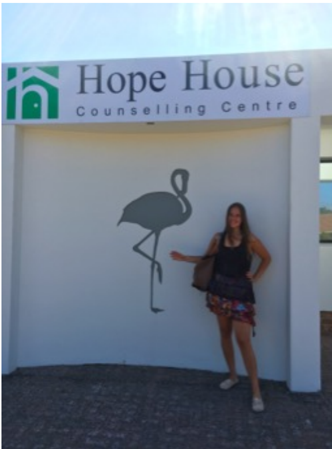
Praktikumsstelle „Hope House“